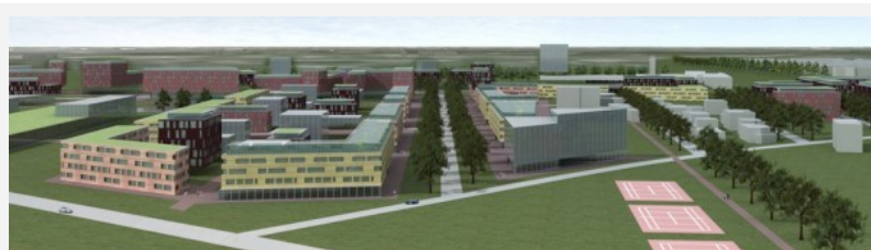
Il futuro di Abbiategrasso previsto dal PGT e ideato dall'arch. Marinoni per il Comune

Quale idea di città ha in mente la nostra Amministrazione comunale? Come si svilupperanno i nuovi quartieri rispetto al centro storico? La risposta purtroppo non è mai stata resa pubblica e soprattutto non è mai stata costruita insieme ai cittadini, nonostante decine di tavoli di (finta) partecipazione costruiti ad arte dal Comune. Ma come era facile intuire, l'Ufficio di Piano sta lavorando dietro alle quinte per riempire di volumi di cemento tutti gli spazi di edificazione previsti. Un primo esempio è il recente Piano attuativo di via Paolo VI, dietro