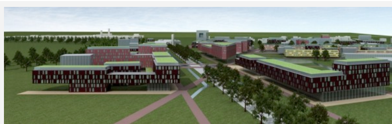
L'urbanizzazione prevista dal PGT di Abbiategrasso dietro al complesso dell'Annunciata (by arch. G. Marinoni)